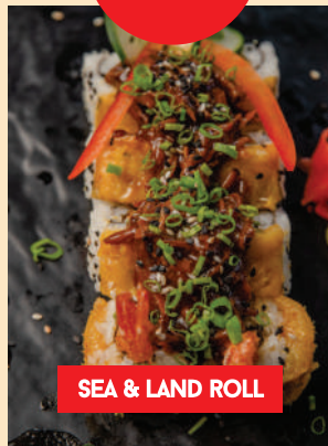
SEA & LAND ROLL